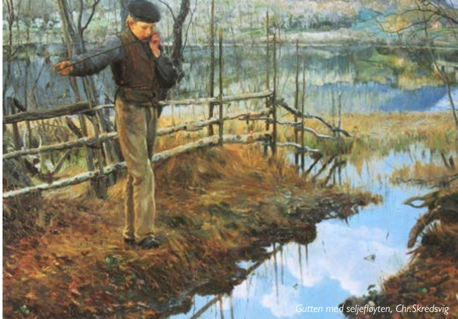
Gutten med seljefløyten, Chr.Skredsvig