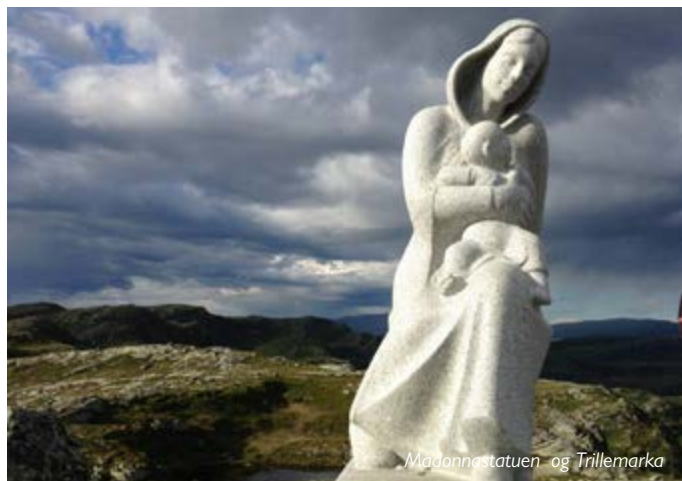
Madonnastatuen og Trillemarka