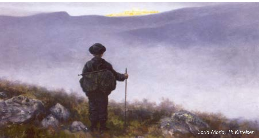
Soria Moria, Th.Kittelsen